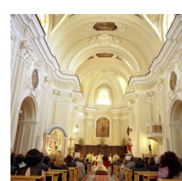
Luoghi di Culto