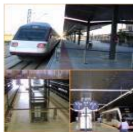
Ferrovie - Tram Metropolitane