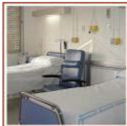
Ospedali Strutture Sanitarie

I prodotti XTE ed OPTIMUS sono comunemente utilizzati in diverse applicazioni quali: