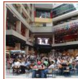
Centri Commerciali Negozii